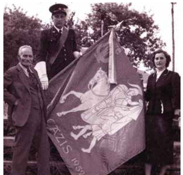
Fahnenweihe im Jahr 1952.

Das 50-Jahr-Jubiläum wurde 1946 gebührend gefeiert. Nicht weniger als elf eingeladene Gastvereine wirkten am 5. Mai 1946 mit. Dank grosszügiger Unterstützung konnte 1952 der langjährige Wunsch nach einer eigenen Vereinsfahne verwirklicht werden.