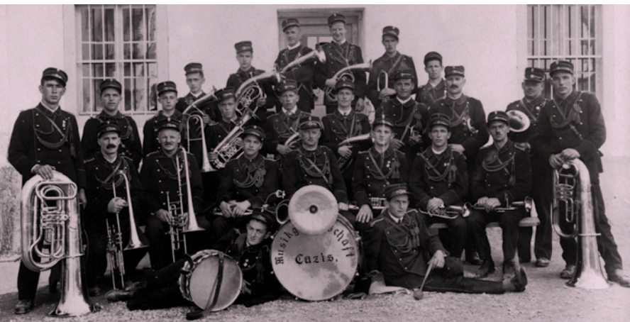
Musikgesellschaft Cazis im Jahr 1937.