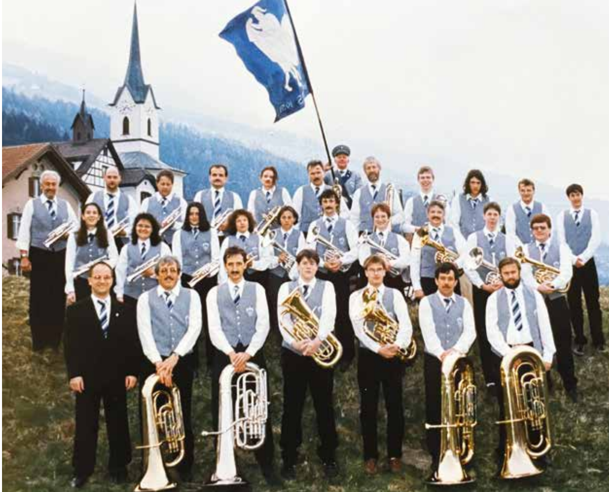
1996: 100-Jahr-Jubiläum der Musikgesellschaft Cazis.