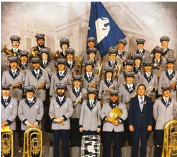
Eidgenössisches Musikfest 1986 in Winterthur.