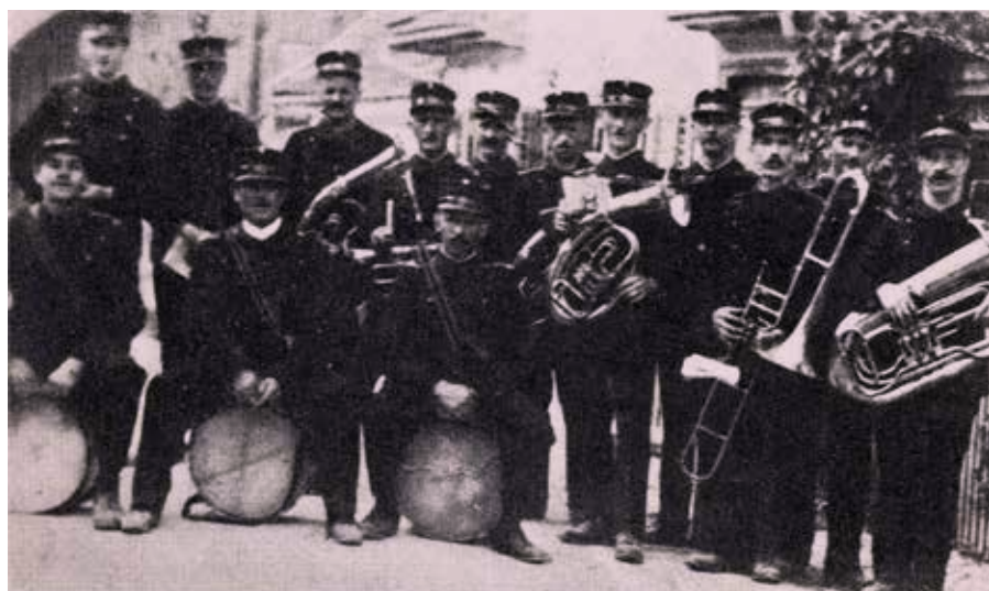
Älteste Aufnahme der Musikgesellschaft Cazis im Jahr 1918.