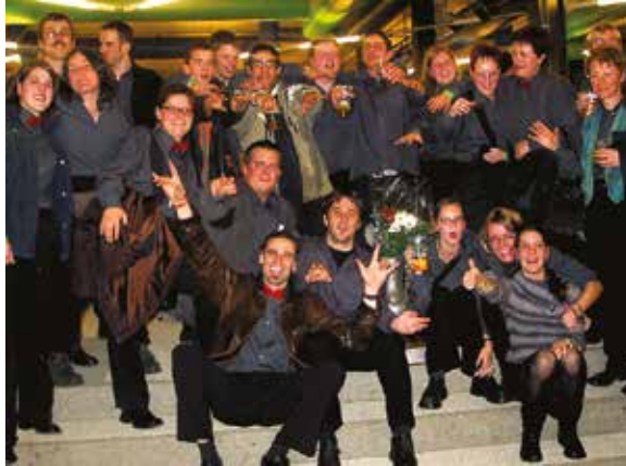
1. Sieg am Schweizerischen Brass Band Wettbewerb 2002.