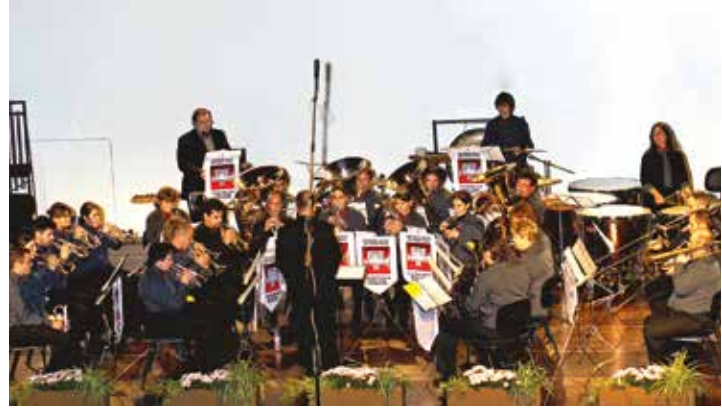
2. Sieg am Schweizerischen Brass Band Wettbewerb 2005.