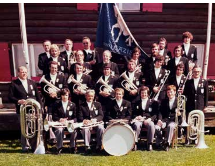
Kantonales Musikfest 1975 in Lenzerheide.