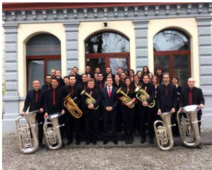
2. Rang am Schweizerischen Brass Band Wettbewerb 2014.