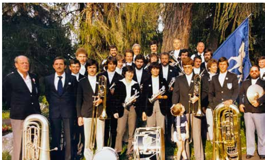
Kantonales Musikfest 1983 in Flims.