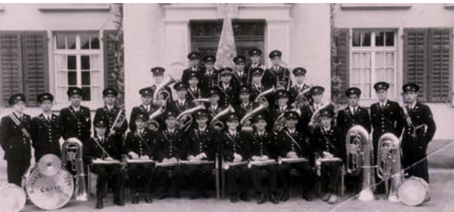
1946: Zum 50-Jahr-Jubiläum.

Aus der Musikgesellschaft wird eine Brassband Sieben Jahre nach der Gründung erfolgte 1903 der Beitritt in den Kantonalen Musikverband. Bereits ein Jahr später wagte sich die Musikgesellschaft Cazis an das Kantonale Musikfest in Ilanz. Obwohl die Bewertung des Vortrages nicht sehr schmeichelhaft ausfiel, stellte dies kein Hindernis für das weitere gemeinsame Musizieren dar. Im eigenen Dorf trat die Musikgesellschaft Cazis konzertmässig erstmals am 2. Dezember 1917 auf. Im Restaurant Weiss Kreuz standen zehn Stücke auf dem Programm.