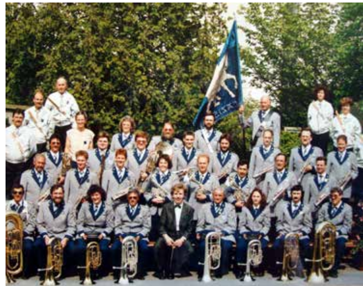
Luzerner Kantonales Musikfest 1990.