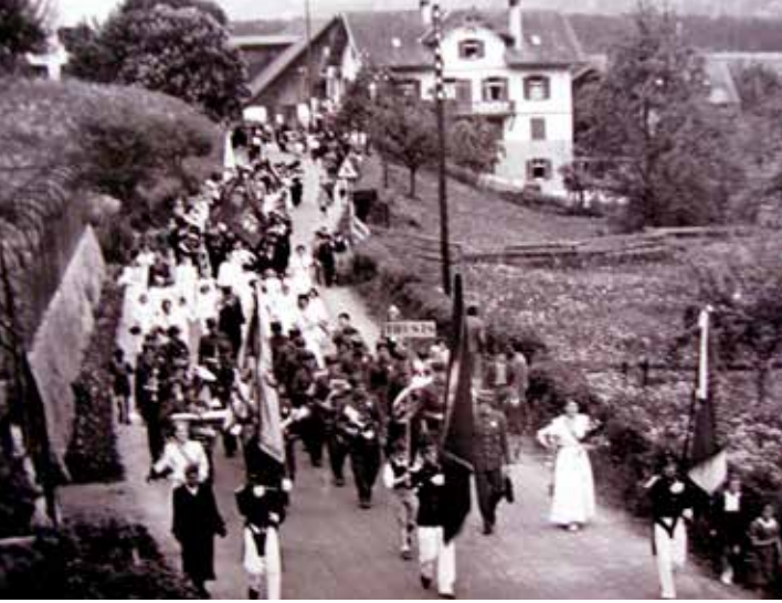
1955: Umzug durch Cazis nach Kantonalem Musikfest.