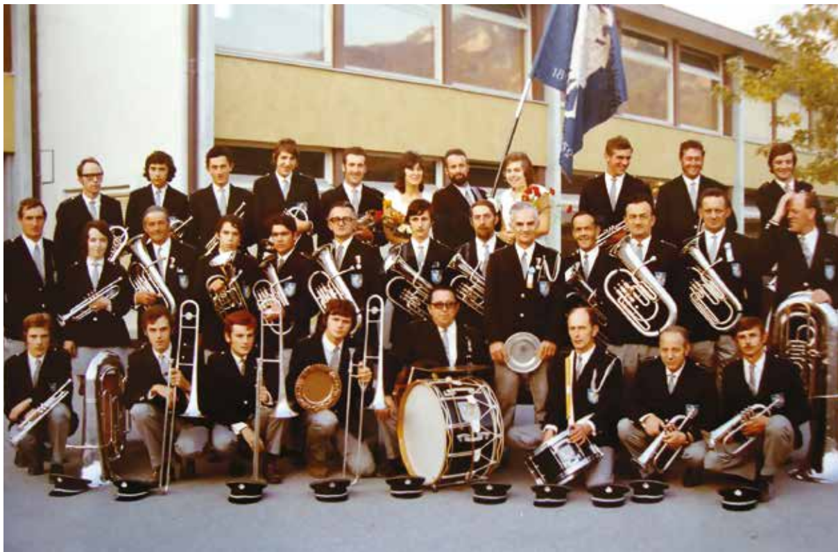
1971: 75-Jahr-Jubiläum der Musikgesellschaft Cazis.